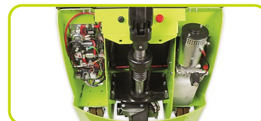
PLATE-FORME DE L'OPERATEUR

Par démontage du capot vous avez accès aux systèmes hydraulique et électrique ainsi qu'aux roues motrices et stabilisatrices.