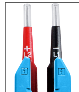
Pointes de touche IP2X (2mm et 4mm)