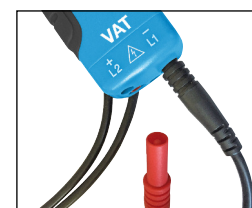
cordons pointes de touche détachables