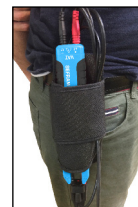
SC523 Etui ceinture