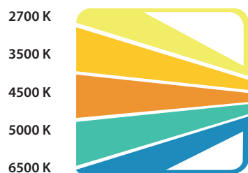
5 Color Match

La lampe SUNCOLOR 5 offre la possibilité de choisir entre 5 couleurs différentes pour évaluer les teintes de peinture en carrosserie, par simple appui sur le bouton de sélection dédié. 3 intensités lumineuses différentes sont également disponibles (500 / 1000 / 2000 lumens).