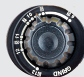
Teinte 5>13 et mode meulage