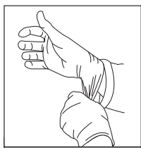
1. PORTER DES GANTS