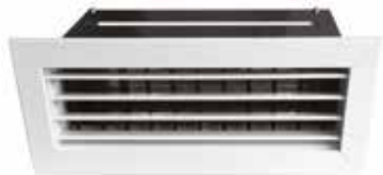
Bouche motorisée T.One® L200xH100 noire et blanche