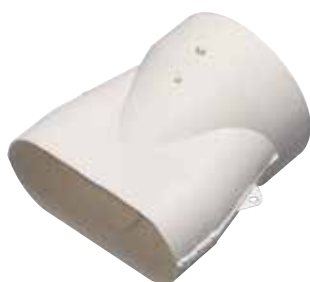
Raccord mixte pour conduit Ø80 mm