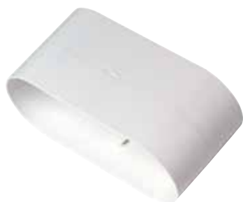
Raccord femelle 40x100 mm