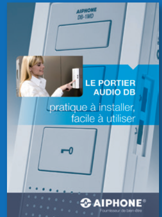
SÉRIE DB Le portier audio pratique à installer, facile à utiliser