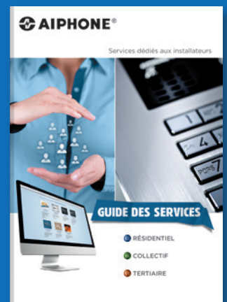
GUIDE DES SERVICES