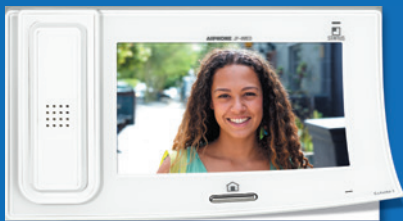
SÉRIE JP Portier vidéo JP, la protection idéale de votre logement