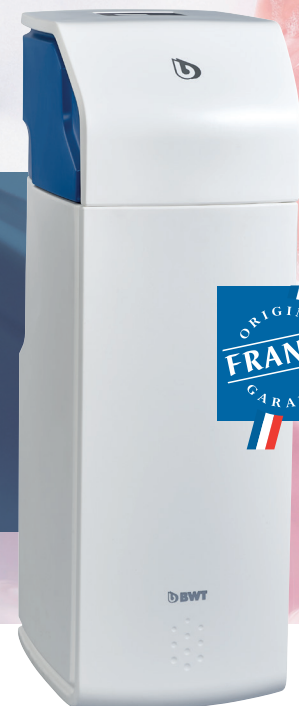
PERLA SPHÈRE XL

ADOUCCISSEURS BWT PERLA SPHÈRE LA QUALITÉ FRANÇAISE AVEC LE SERVICE EN +