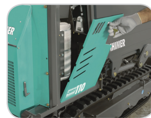
CAPOT MOTEUR FACILE D'ACCÈS