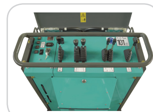
CONSOLE DE COMMANDE INTUITIVE