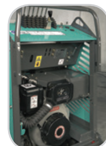
LARGE OUVERTURE DU CAPOT MOTEUR POUR UN ENTRETIEN FACILITÉ (DIESEL)