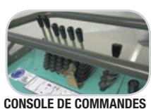
CONSOLE DE COMMANDES

✓ Large ouverture du capot moteur pour faciliter l'entretien