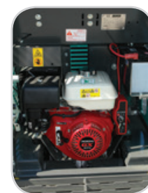
LARGE OUVERTURE DU CAPOT MOTEUR POUR UN ENTRETIEN FACILITÉ (ESSENCE)