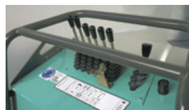
Console de commandes