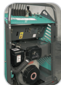
LARGE OUVERTURE DU CAPOT MOTEUR POUR UN ENTRETIEN FACILITÉ (DIESEL)