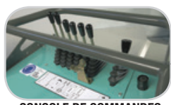
CONSOLE DE COMMANDES