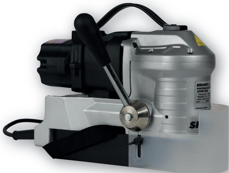
35 PM HPR .....