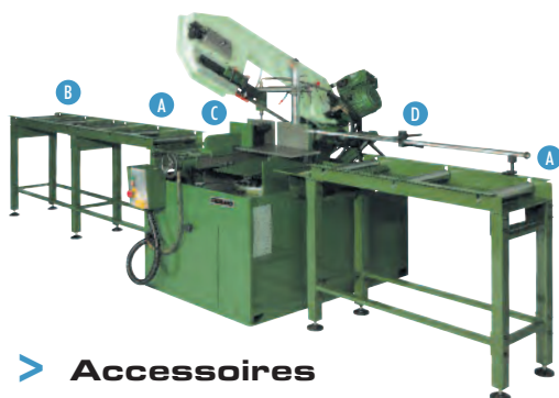
SR 450 BSA VA .....

Détendre le ruban en fin de journée. Afin d'obtenir une excellente finition de coupe et une grande longévité du ruban, il est impératif de choisir la denture du ruban, d'adapter la vitesse de descente de l'archet et la vitesse du moteur en fonction du profil de la pièce à couper.