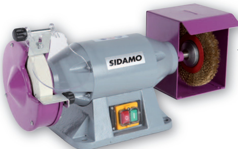
TM 150 B

✓ Conseils d'utilisation : Par mesure de sécurité, nous vous rappelons qu'il est obligatoire de fixer le touret sur un socle ou sur un établi.