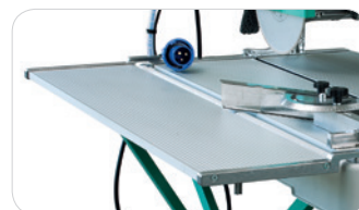
GRANDE CAPACITÉ DE COUPE