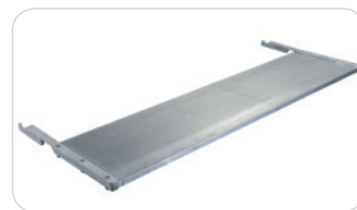
PLAN ADDITIONNEL EN OPTION