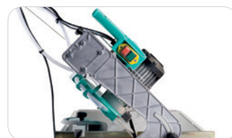
COUPE À 45°