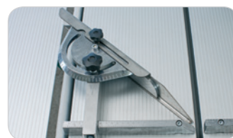
COUPE À 90°