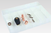
Coffret consommables pour Torche TPT 40 45 A - 039957