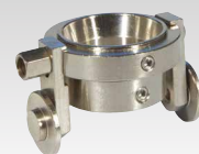
Chariot pour Torche TPT 40 040199